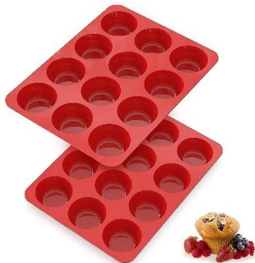
Molde de silicona